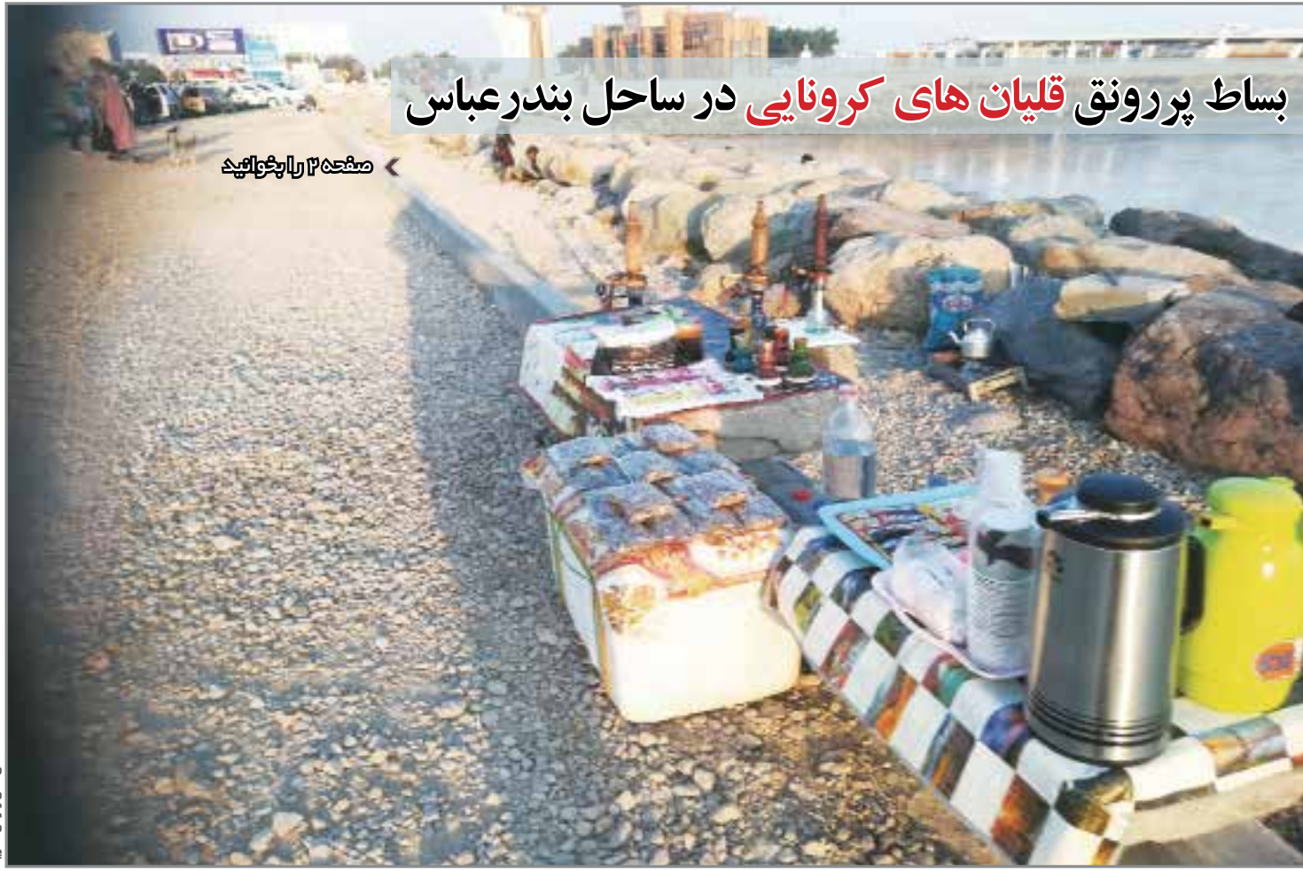
صفحه ۱۲ را بچرخانید