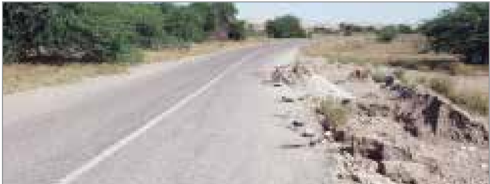
عکس مربوطبه گزارش سال ۹۹