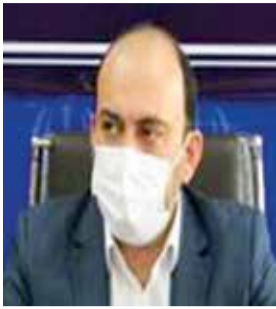
گروه خبر //استاندار هرمزگان پس از تحقق گام نخست شفافیت در استانداری هرمزگان، از انتشار مزایده‌ها، مناقصه‌ها، گردش های

گروه خبر // مدیرکل مدیریت بحران استانداری هرمزگان گفت: خروچی نقشه‌ها و مدل های هوشناسی برای روزهای آینده بیانگر ناپایداری وضعیت جوی و دریایی است که موجب اختلال در ترده های دریایی و احتمال آسیب به شناورهای سبک و تورهای صیادی می شود.