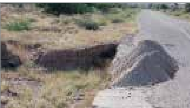
عکس مربوطبه گزارش سال ۹۹

از کنار هم عبور کنند این کار به سختی انجام می‌شود. باید پیش از روکش کردن جاده کمی به عرض آن اضافه می‌کردند زیرسازی خوبی صورت می‌گرفت و بخش هایی که جاده تخریب شده بود را به صورت اساسی مرمت می‌کرد اما این کار را انجام نداده و فقط به روکش کردن آن بسنده کردند و اکنون وضعیت جاده به حدی خراب است که اگر بارندگی دیگری صورت پذیرد امکان دارد دیگر این جاده قابل استفاده برای اهالی این منطقه نباشد. این موارد بخشی از مشکلاتی که در جاده روستایی بین روستای چاه فعله به گوود شهروندان و روستائیان که در این منطقه زندگی می‌کنند با آن مواجه هستند سال گذشته نیز روزنامه دریا بر اساس رسالتی که داشت در این زمینه گزارشی تهیه و منتشر کرد اما به دلیل اینکه مورد توجه مسئولان قرار نگرفت و فقر چاره ای اساسی برای آن اندیشیده نشده، وضعیت جاده ها هم اکنون به حدی خراب است که دیگر تردد در آن برای رانندگان بسیار خطرناک است. اگر اکنون مسیری استفاده می‌کند می‌گوید: چند سال پیش برای اینکه این جاده از وضعیت خرابی که داشتند بیرون بیاید، آن جاده ها هم اکنون به حدی خراب شده است که دیگر تردد در آن برای رانندگان بسیار خطرناک است. اگر اکنون مسیری استفاده می‌کند می‌گوید پر کردن چاله ها و قسمت هایی که با بارندگی تخریب شده است به وسیله خاک و رها کردن آن به حال خود مشکلاتی که اکنون موجود است را به وجود آورده است و