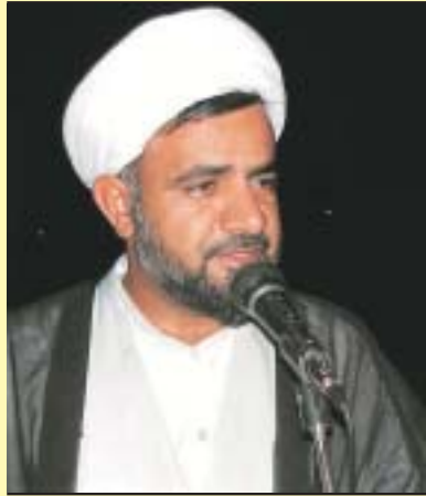
یاقری فرد - امام جمعه حاجی آباد