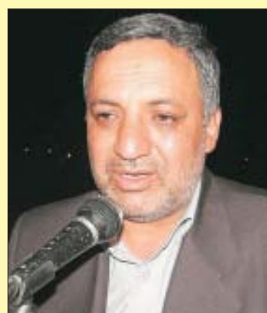
سالاری - فرماندار حاجی آباد