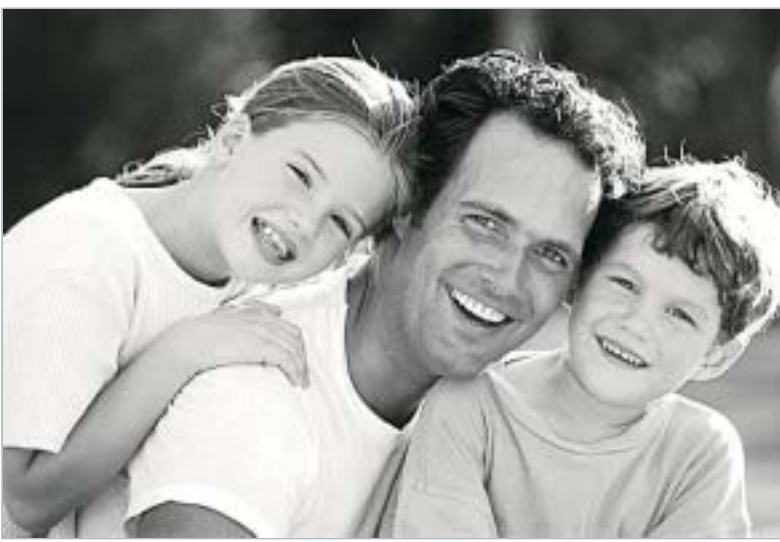
عشق به کانون خانوادگی،رحمتی است که خداوند در

مادر وظیفه سونگدینی عهده دار بود . که از یک طرف سعی در یاد دادن آداب و رسوم ملی به طفل داشت و از طرف دیگر می کوشید که کودک را از معاشرت با هم بازیهای ناباب و ناشایسته دور کند .