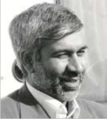
مدیرکل تعاون هرمزگان گفت: اسسال دو هزار

میلیارد ریال تسهیلات بانکی به بخش تعاون این استان پرداخت می شود.